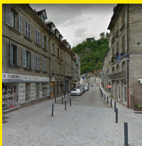
Rue Vaveix 23 200 Aubusson