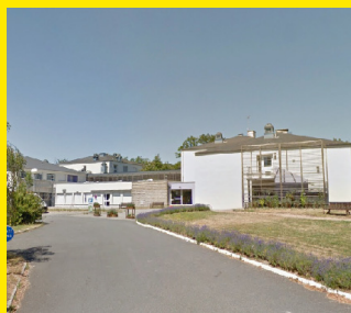
Résidence Pierre Guilbaud 23 320 Bussière-Dunoise

IPNS - CHLV - Service Communication V01-2019